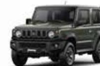
VERDE JUNGLA (ZCC)