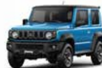
AZUL (CZW) | TECHO NEGRO