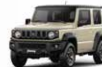
BEIGE (2BW) | TECHO NEGRO