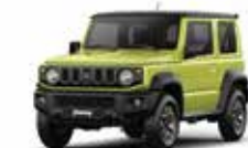
VERDE KINETIC (DG5) | TECHO NEGRO